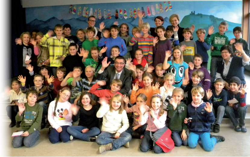
Fotos: „Mittendrin“ mit Bundetagsabgeordnetem Dr. A. Schockenhoff (oben) und Frank Hautumm, Regionalleiter der Schwäb. Zeitung (unten)

Im Jahr 2013 wurden 484 Kinder im Rahmen dieser Aktionen beteiligt.