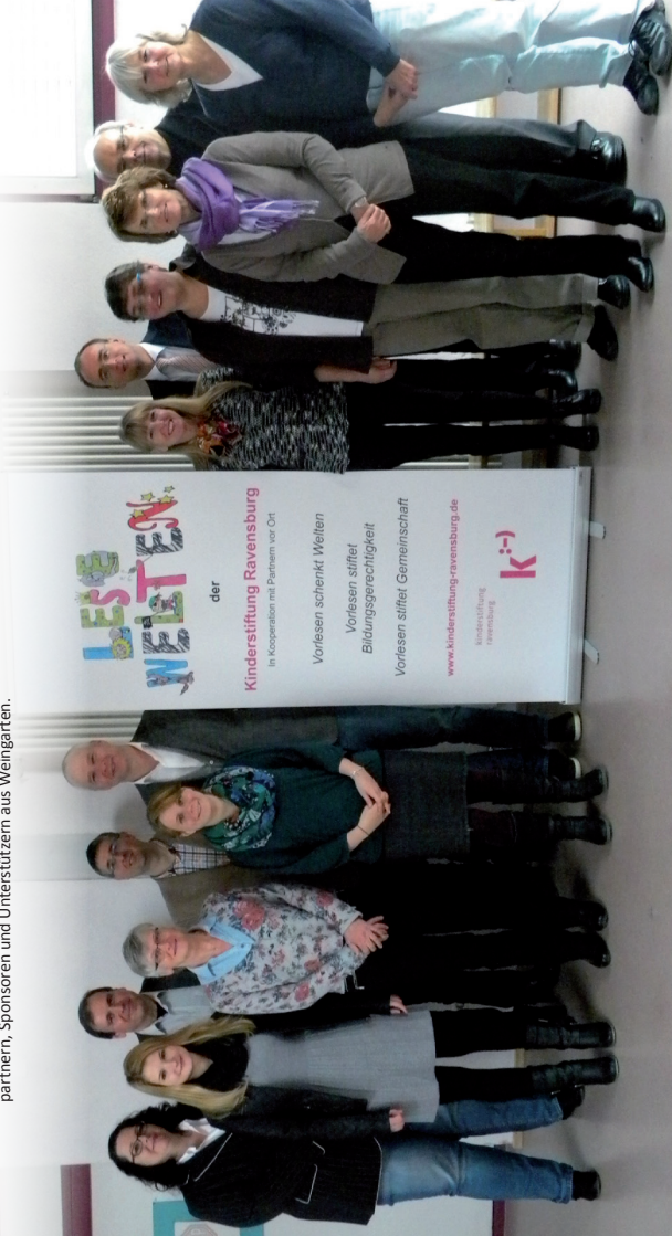
Foto: Start des Projektes im Jahr 2013 im Kindergarten St. Loba mit Projektverantwortlichen, Kooperationspartnern, Sponsoren und Unterstützern aus Weingarten.

Bis Ende 2013 wurde bis zu 300 Kindern regelmäßig vorgelesen.