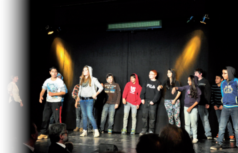
Fotos: Theatergruppe St. Christina (oben) und „Freches Blech“ St. Johann (unten)

Diese Förderung kam insgesamt 120 Kindern zugute.